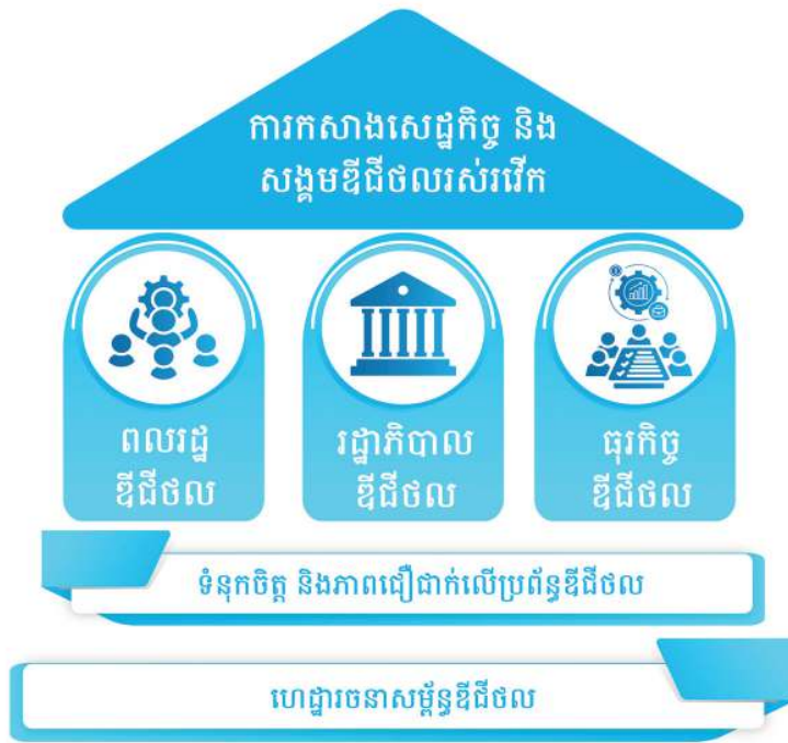
រូបភាពទី២. គំនូរបំប្រួញស្តីពី «យុទ្ធសាស្ត្របញ្ជាកោណ - ដំណាក់កាលទី១»